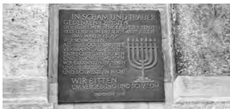
Jüdische Gedenktafel; Foto: Frank Walther

Jeweils zur vollen Stunde gibt es ein kurzes Gedenkwort seitens der Stadt und der Kirchen. Ein Vertreter der Jüdischen Gemeinde spricht zum Abschluss gegen 15.30 Uhr das Kaddisch. Die Namen werden gelesen von Dresdner Schülerinnen und